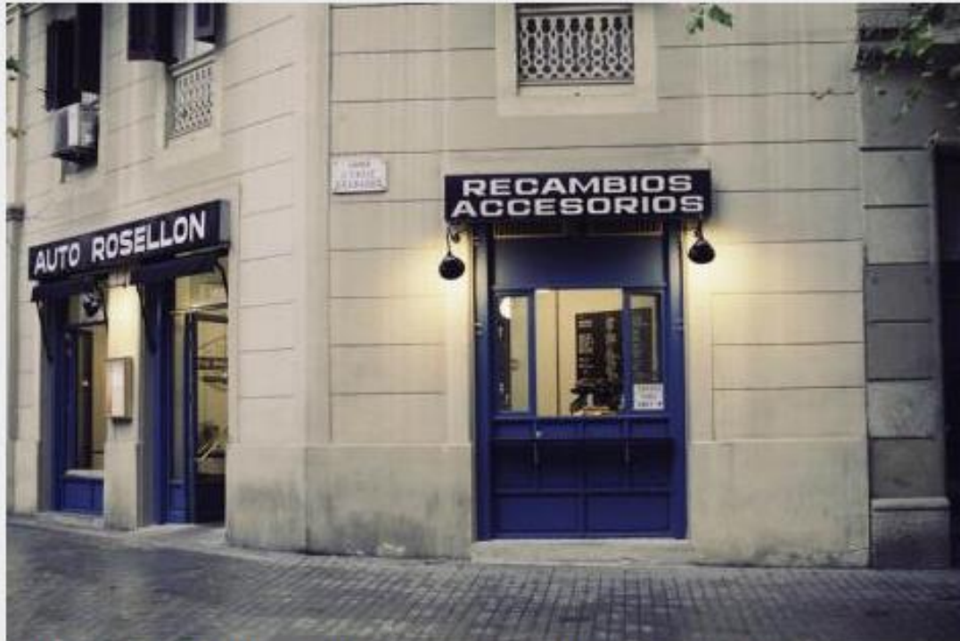
Auto Rosellon está ubicado en la esquina de Enrique Granados con Rosellon